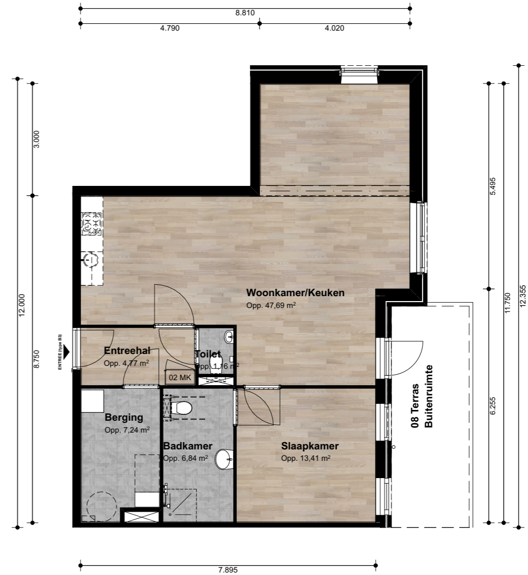
Type B3 BGG Aantal: 1 st. GO: 83,42 m 2