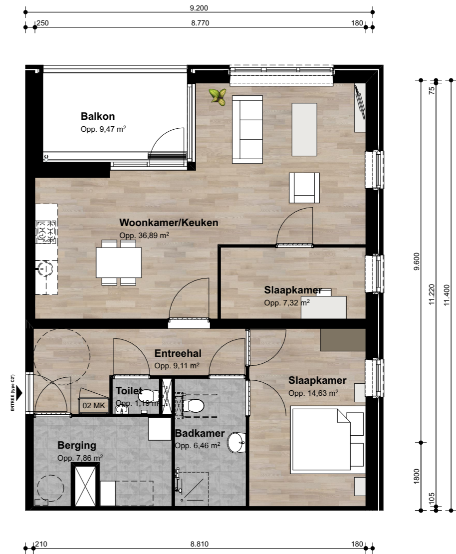
Type C2' Aantal: 3 st. GO: 85,60 m 2