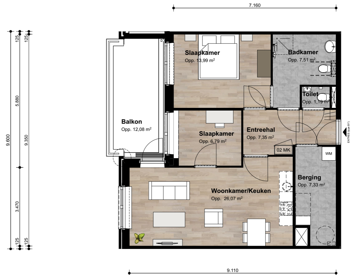
Type B1' Aantal: 5 st. GO: 72,94 m 2